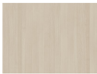
Ash white pigmented