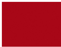
Xtreme Plus 4531