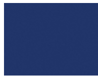
Xtreme Plus 4553