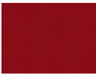
Xtreme Plus 4530