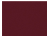
Xtreme Plus 4538